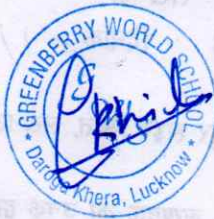
Principal Greenberry World School Lucknow